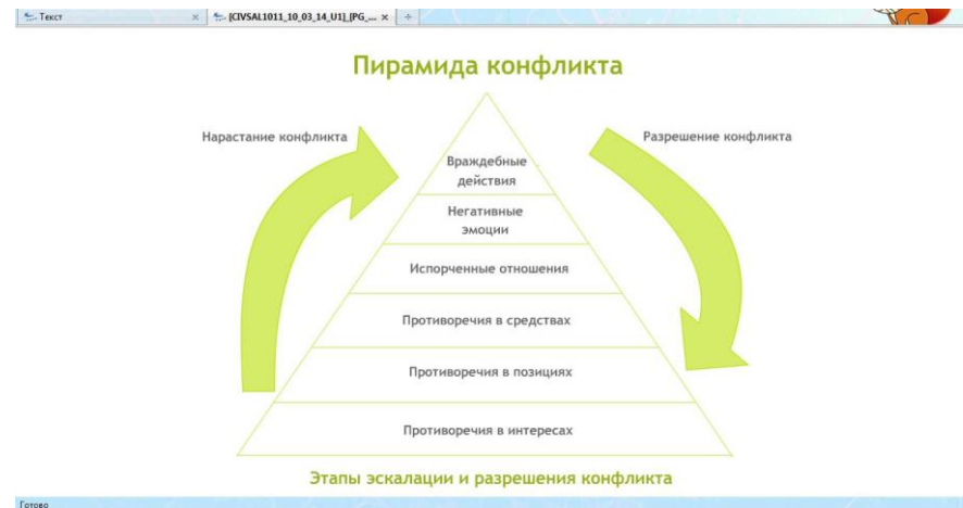
Схема – это способ представления информации. Схематизация материала – не самоцель, а лишь способ выделить самое существенное, при этом показать наглядно структуру изучаемого объекта или важные связи его с другими сторонами или объектами.

При выборе форм работы с ЦОР данного типа следует также отталкиваться от их содержания. В данном случае целесообразно предложить учащимся смоделировать конкретные социальные ситуации, иллюстрирующие разные этапы пирамиды социального конфликта. На более высоком уровне можно предложить им рассуждение на тему, в какой степени вообще возможно устранение противоречия в интересах разных членов общества. Тогда задание будет носить проблемный характер, будет ориентировано на развитие такого умения как «наблюдение и оценка явлений и событий, происходящих в социальной жизни, с опорой на экономические, правовые, социально-политические знания».